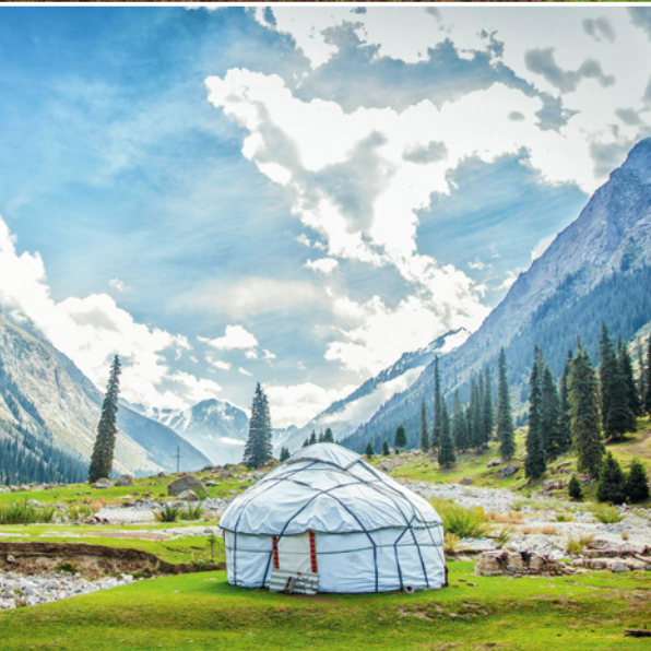
Jurte in Kirgistan