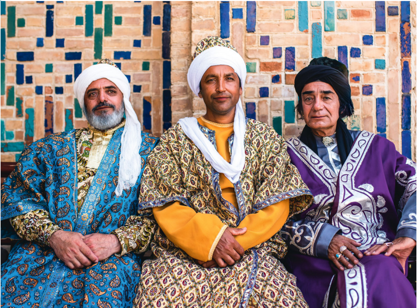
Traditionelle usbekische Kleidung