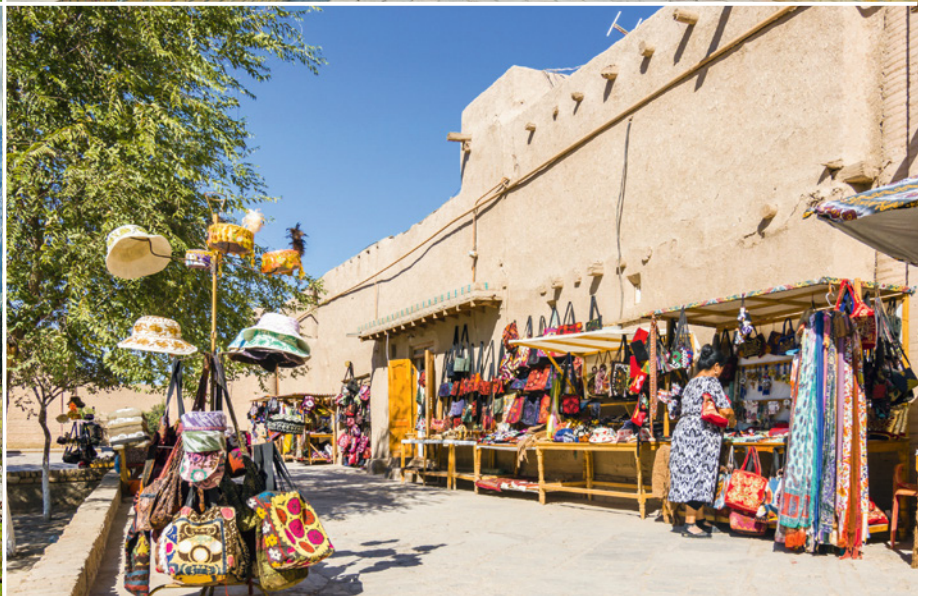
Markt in Chiwa

5. Tag Taschkent (Usbekistan) Morgens trifft Ihr Sonderzug in Taschkent ein. Stadtrundfahrt mit Medresse Kukeldash, Kavoj- und Amir-Timur-Denkmalern und den typischen Lehmhäusern. Sie übernachten im Komfort-Hotel. (FMA)