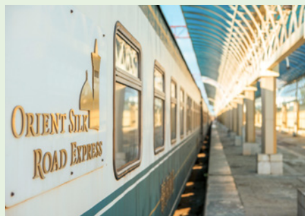
Sie fahren mit dem Orient Silk Road Express.

„Als Reise-Lektüre empfehle ich die oft sehr deftigen Anekdoten um den orientalischen Spaßvogel Nasreddin.“